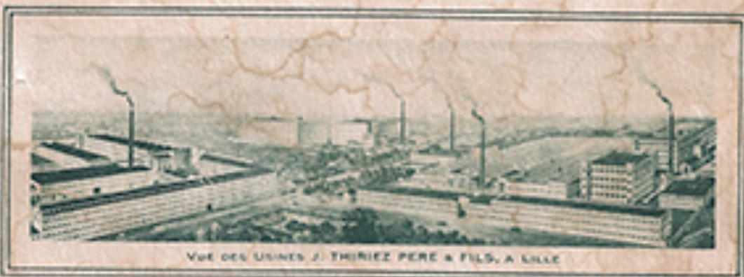
Vue des Usines J. Thiriez Père & Fils, à Lille

EST LE MEILLEUR POUR LA COUTURE A LA MAIN ET A LA MACHINE